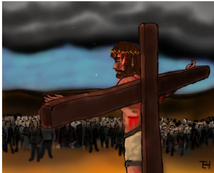
Christ died for sinners!

Roma 6:23 Ay anang bayad ang pagpakasala kamatayun, piro kaboi tana nga ara kataposan anang ginaringalo ang Dios sa mga tao nga kay Cristo Jesus nga atun Ginoo.