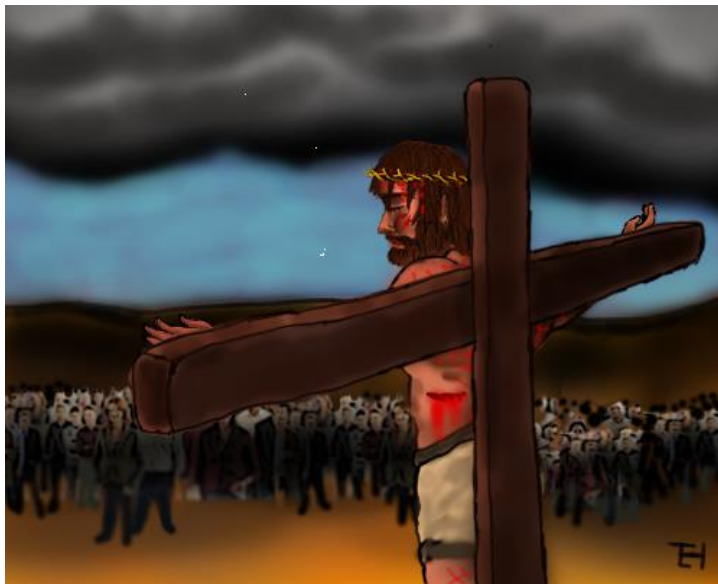
Christ died for sinners!

Roma 6:23 Wanin ta say upa' nin paaripen sa kasalanan ket say patiti tan pakaisyay konan Dios; bale' say ibi nan Dios mangibwat sa masibulot a nakem na ket say anggan-angga nin byay a iti kona yupa' kona ni Uunuren tamon si Jesus a syay Cristo.