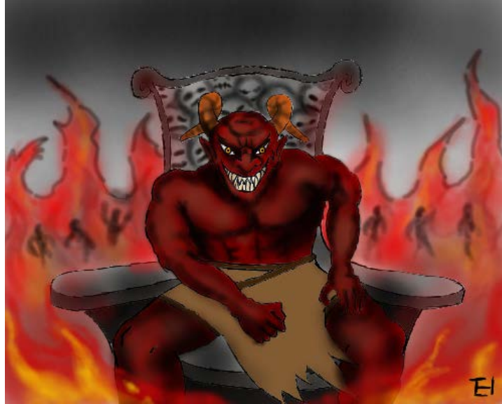
Adunay bayad sa. sala

15 Ug kon ang ngalan ni bisan kinsa dili makaplagan nga nahisulat diha sa basahon sa kinabuhi, siya itambog ngadto sa linaw nga kalayo.