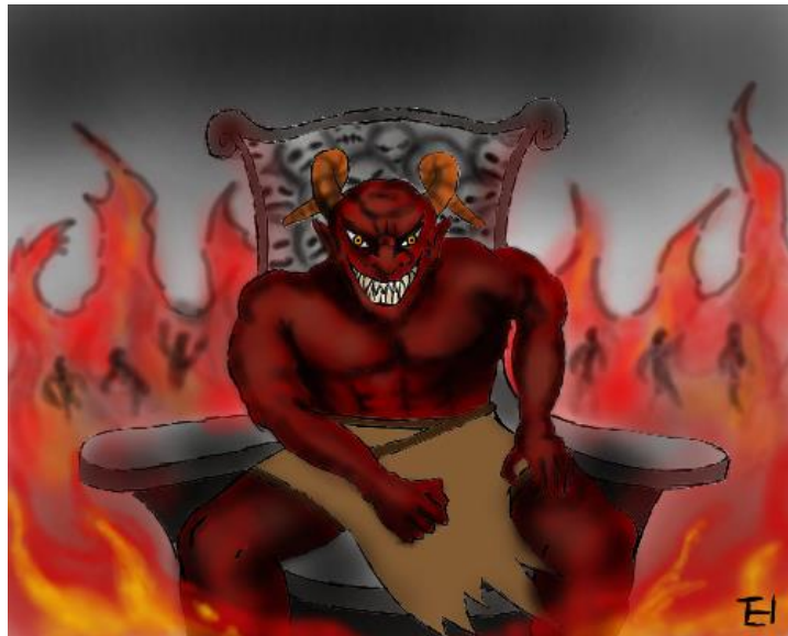
Adunay bayad sa. sala

15 Ug kon ang ngalan ni bisan kinsa dili makaplagan nga nahisulat diha sa basahon sa kinabuhi, siya itambog ngadto sa linaw nga kalayo.